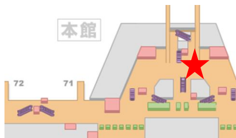
第2旅客ターミナルビル制限エリア2階 イベントスペース