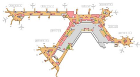
第1旅客ターミナルビル制限出発エリア