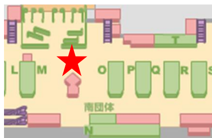
第2旅客ターミナルビル3階 出発ロビー南側スカイリウム