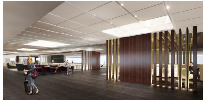
第2ターミナル連絡通路(イメージ)

また第1ターミナル新館中央エリア(南北両ウイングをつなぐエリア)に、以下の通りラウンジスペースを拡張する等、更なる充実を図ります。