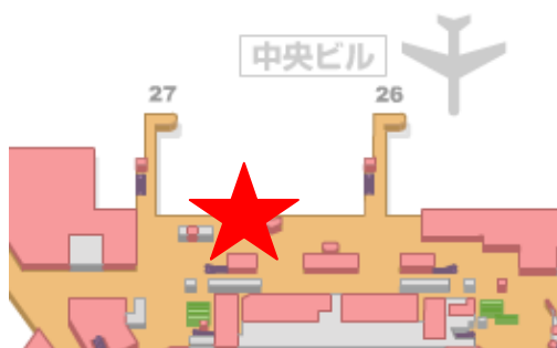
【第1旅客ターミナル】