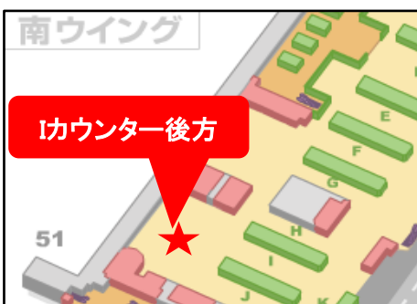
第1旅客ターミナルビル 出国審査前 4階南ウイングIカウンター後方