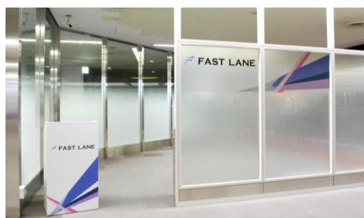
【1PTBファーストレーン】

成田空港は、2020年に向けて訪日外国人が急増していく中、迅速で、ストレスフリーな空港内手続きの提供を実現し、世界トップレベルの快適な空港を目指してまいります。