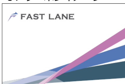
【クーポンイメージ（表）】