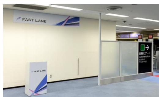
【2PTBファーストレーン】