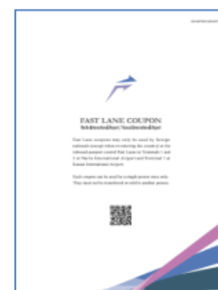
【国際会議用クーポンイメージ】

※ファーストレーンのご利用は、当社と航空会社・会議運営会社との利用契約に基づき、提供させていただきます。