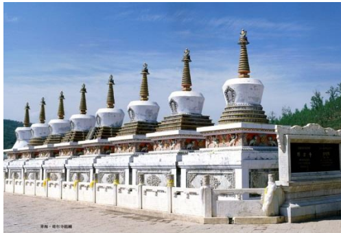
西寧は、チベットへの玄関口としても人気の都市です。 画像は西寧にある、チベット仏教最大の寺院、タル寺。

西寧は、中国の西部に位置する青海省(せいかいしょう)の省都です。また、世界最高峰の高山鉄道である青蔵鉄道(青海チベット鉄道)の始発駅があり、チベットへの玄関口としても人気の都市です。週4便で運航している成田—成都線を西寧まで延伸することで、チベットや中国内陸部へのアクセスがより便利になります。