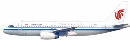
使用機材は A320 (ビジネス:8席、エコノミー:150席)