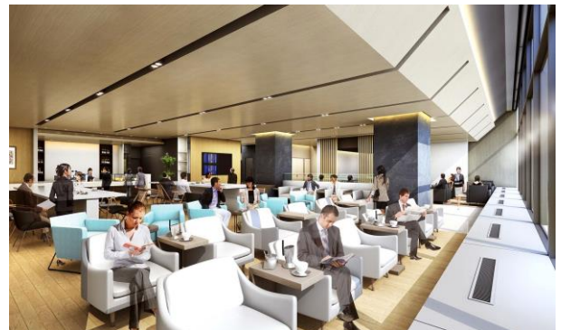
【ラウンジ内イメージ】