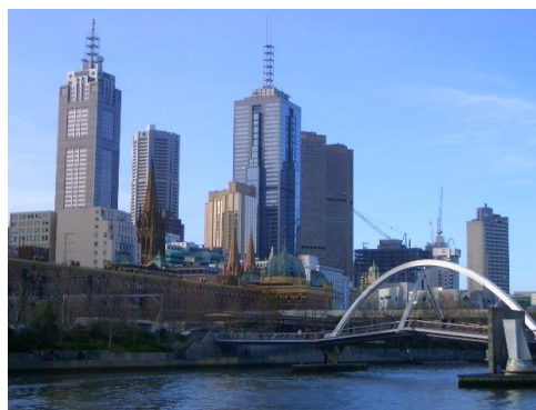
～メルボルンの街並み～