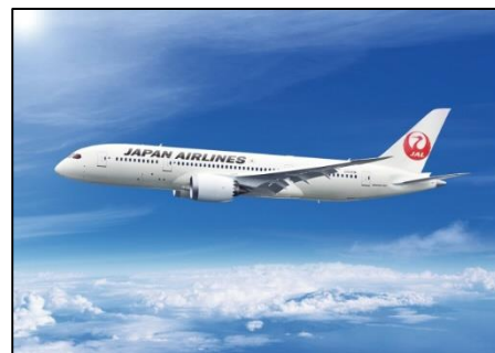
<写真: B787-8 日本航空提供>