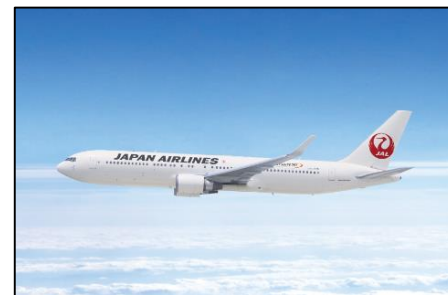
<写真: B767-300 日本航空提供>