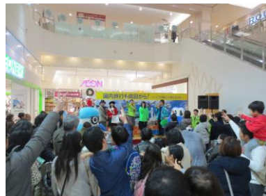
じゃんけん大会(イメージ)