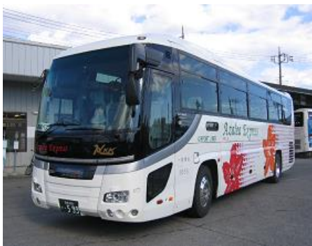
高速バス「アザレア号」