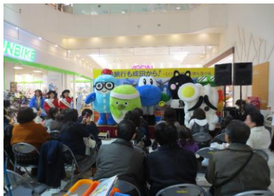
ご当地キャラクター大集合(イメージ)