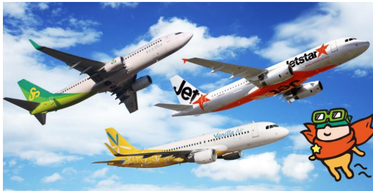
左上: Spring Japan 中央下: バニラエア 右上: ジェットスター・ジャパン 右下: 成田空港 マスコットキャラクター クウタン

成田国際空港(株)、関越交通(株)、千葉交通(株)、ジェットスター・ジャパン(株)、Spring Japan(春秋航空日本(株))、バニラ・エア(株)は、9月30日(土)に「けやきウオーク前橋(所在地:群馬県前橋市)」において、アザレア号とLCC(格安航空会社)を利用した6社連携による成田空港発の国内旅行需要喚起プロモーションを群馬県で初開催致します。