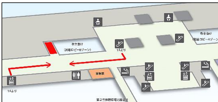
(位置図・第2ターミナル 本館2F 北側)