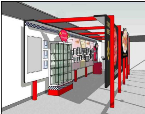
(アニメ聖地 88 に関連する展示イメージ)