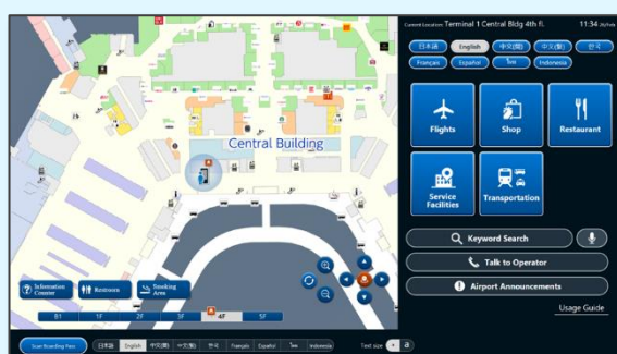
<横型 TOP 画面>

・プリンター、搭乗券リーダー及び受話器を画面左側に内蔵 ・画面角度は操作性を考慮し、横型 40 度、縦型 70 度に設定