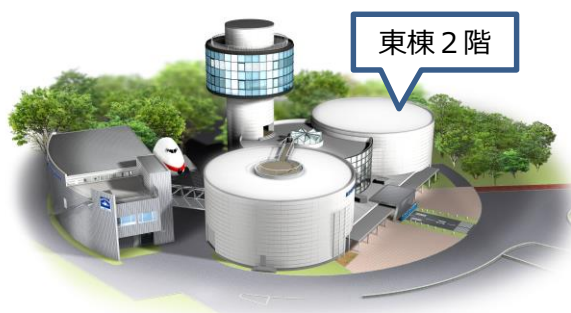
航空科学博物館全景（イメージ）