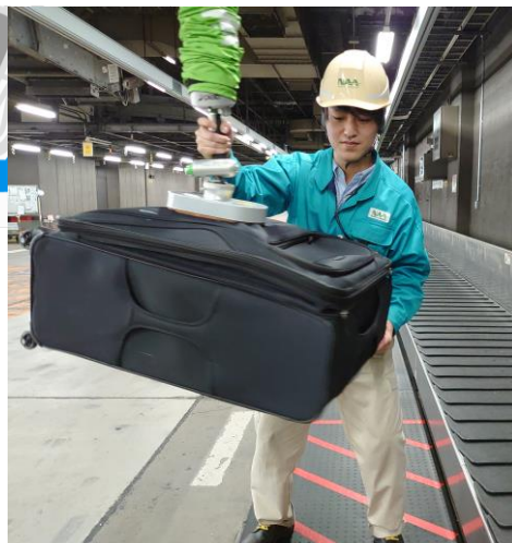
支援装置を用いた手荷物取り下し作業