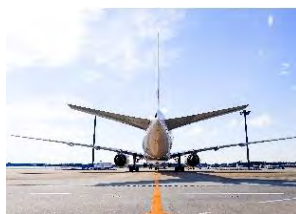
ランプエリア・滑走路（イメージ）