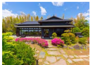
DINING PORT 御料鶴（イメージ）

→農家レストラン「DINING PORT 御料鶴」にて昼食（11：30～12：30）→「STRAWBERRY PORT ICHIGONOMI」（13：00～13：30）