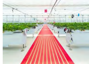
STRAWBERRY PORT ICHIGONOMI（イメージ）