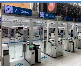
保安検査場入口ゲート