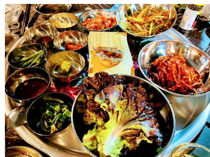
<ソウルのイメージ写真>