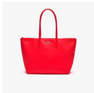
▲L.12.12 プチピケ ラージ トートバッグ