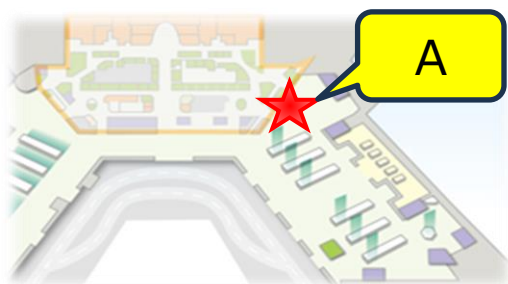
北ウイング 4F 出国手続き前エリア