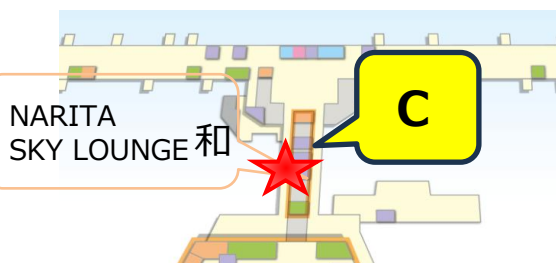
NARITA SKY LOUNGE 和 出国手続き後エリア