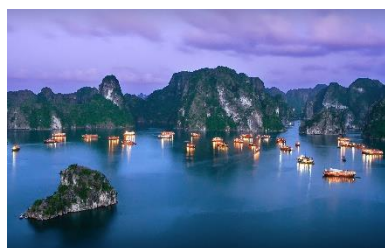
ハロン湾（世界遺産）

VJによるハノイ線の就航により成田空港からベトナムへの旅のスタイルが更に多様化し利便性が向上します。ますます充実する成田空港のネットワークをぜひご活用ください。