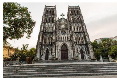
ハノイ大教会（ハノイ市内）