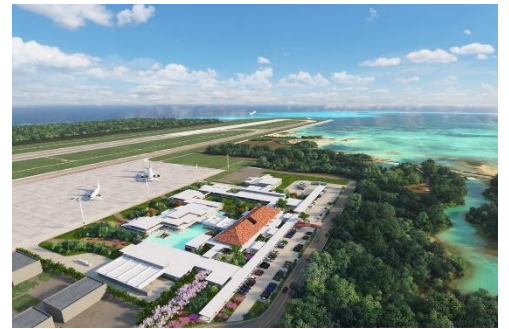
▲旅客ターミナル施設 外観完成予想 CG

国際線を受け入れる専用施設を設け、スムーズな入国・出国動線を確保する等、利用者の動線を意識した設計となっており、使い勝手の良さを追求しています。