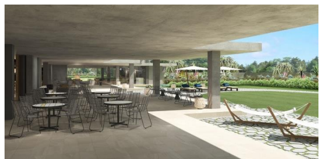
▲出発ラウンジ・テラス 完成予想 CG