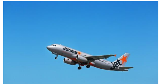
▲ジェットスター・ジャパン エアバス A320 型機