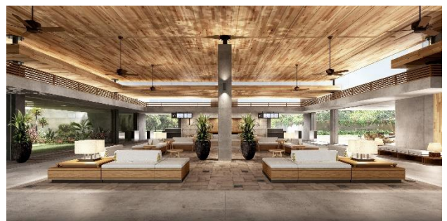
▲国内線搭乗待合室 完成予想 CG