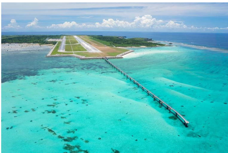
▲下地島空港 鳥瞰写真(北側より)

新しく開業する旅客ターミナル施設は、コンセプト「空港から、リゾート、はじまる。」にふさわしく、溢れるリゾート感を体験してもらえるよう設計しました。国際線を受け入れる専用施設を設け、利用者のスムーズな入国・出国動線を確認しており、台湾、香港、韓国等からの国際線定期便・チャーター便の誘致も積極的に取り組んでいきます。