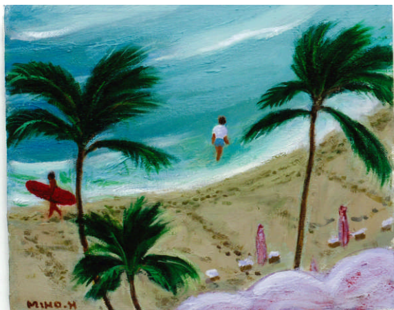
ワイキキ・朝のビーチ

ハワイと香港への旅から感じた、美しい自然あふれるHAWAIIと、密度高い人の暮らしがひしめくHong Kongの雰囲気・・・それぞれに個性的な海の風景の描写を約20点展示いたします。ぜひご高覧下さい。