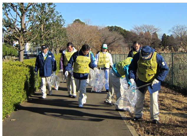
2011年度冬季のクリーンアップ運動の様子