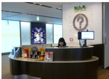
<カウンター設置図>