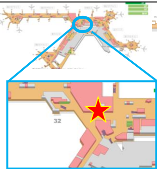
第1 旅客ターミナルビル 3階