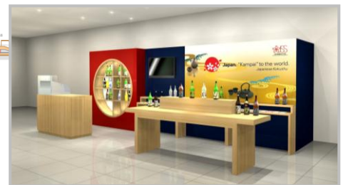
キャンペーンブースのイメージ