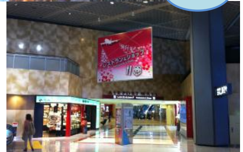
北ウイング エントランス