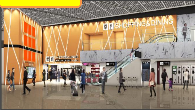
南ウイング エントランス