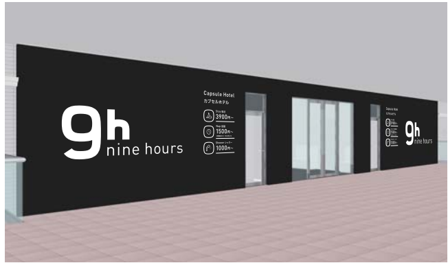
エントランス イメージ