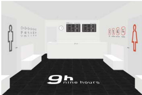
フロント イメージ

フロントを挟んで男女が完全に分かれたレイアウト。 24時間受付(常駐スタッフが対応) フライトインフォメーションボード設置。