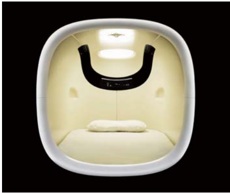
ユニット正面 イメージ

[ナインアワーズ] お客様の旅のスタイルにあわせた機能的な滞在施設として2009年にスタートした京都店は、外国人利用客が半数を占める。清潔感、利便性、寝具やアメニティの品質にもこだわり快適性も追求し従来のカプセルホテルのイメージとは一線を画した、女性や外国人のお客様にも安心してご利用いただける宿泊施設。