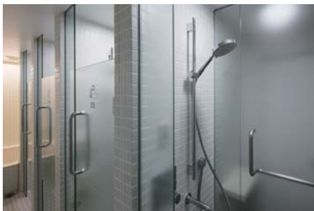
シャワー室 イメージ

フロントを挟んで男女が完全に分かれたレイアウト。 24時間受付(常駐スタッフが対応) フライトインフォメーションボード設置。