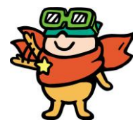
成田空港キャラクター クウタン