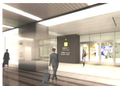
地下1階エレベーターホール