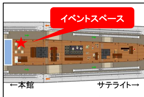
第2旅客ターミナルビル 出国審査後「NARITA SKY LOUNGE 和」エリア内イベントスペース