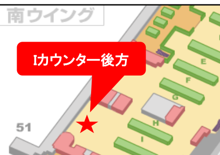
第1旅客ターミナルビル出国審査前4階南ウイングカウンター後方