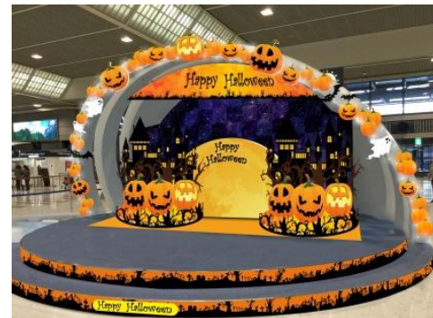
■第2ターミナル3階 SKYRIUM （装飾イメージ）

お客様にハロウィンの記念写真撮影をお楽しみいただけるよう、第2ターミナル3階のイベントステージ「SKYRIUM」にハロウィンの装飾を施します。