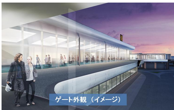
ゲート外観 (イメージ)

成田空港第2旅客ターミナル本館南側において、現在増築工事中の固定ゲート(小型機を駐機する場合は4スポット、大型機を駐機する場合は2スポット使用することができるマルチスポット)を、年末年始繁忙期前の12月17日にオープンすることとなりましたのでお知らせいたします。