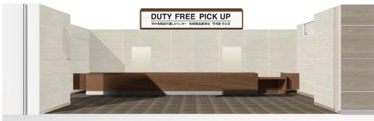
【イメージ図 (第1旅客ターミナル)】

本サービスの開始により、訪日外国人のお客様はもちろんのこと、海外にお出かけになる日本人のお客様にも、出発前に十分に余裕のある免税品のお買い物ができるようになり、今までにない新しい免税品のショッピングスタイルをお楽しみいただけるようになります。