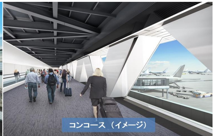
コンコース (イメージ)

このオープンにより、第1旅客ターミナル全体の固定ゲート数は37スポットから39スポットへ増加いたします。固定ゲートに駐機できる航空機が増加することで、ターミナルと航空機間の移動がよりスムーズとなるなど、お客様の利便性が向上し、航空会社の定時運航にも寄与いたします。