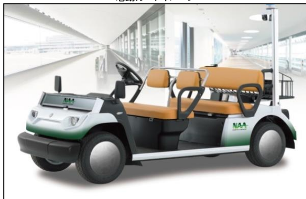
電動カートイメージ

成田空港は、全てのお客様にとってご利用しやすい空港を目指し、利便性の更なる向上を図ってまいります。