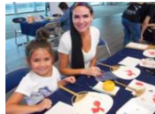
<ちぎり絵体験の様子>

6月は、お土産として大変好評をいただいている浮世絵版画刷り体験をはじめ、ちぎり絵体験や着物・甲冑の着装体験などをお楽しみいただけます。