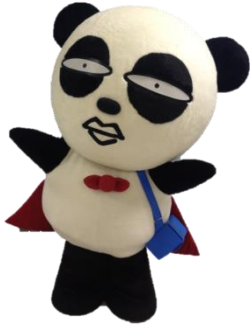
京成電鉄の マスコットキャラクター、京成パンダ