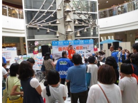
ジェットスターPR(イメージ)