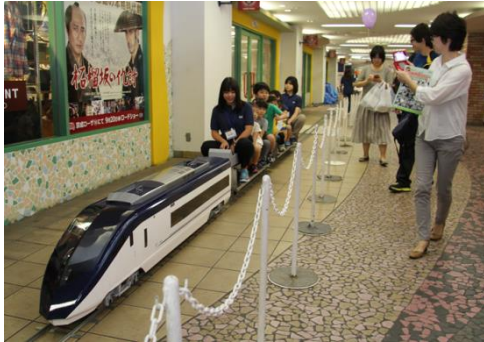
ミニスカイライナーの運行(イメージ)