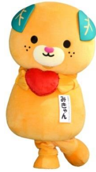
愛媛県の イメージアップキャラクター、みきゃん