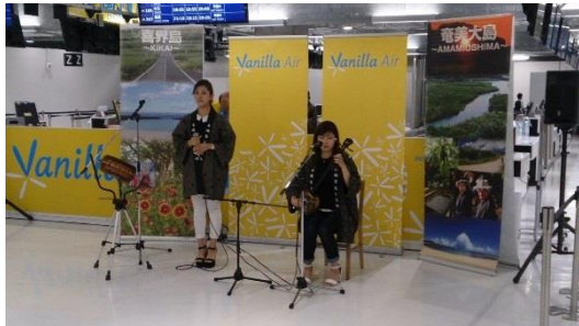
島唄ライブ(イメージ)