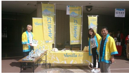
スタンプラリー(イメージ)