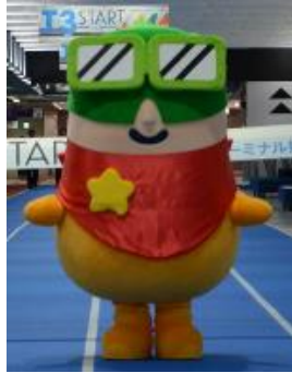
成田国際空港の マスコットキャラクター、クウタン