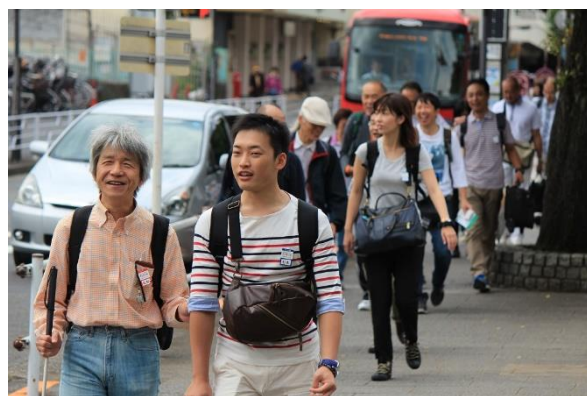
近畿日本ツーリスト社員による バリアフリー旅行研修の様子