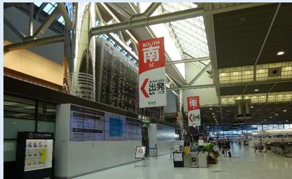
成田空港イメージ