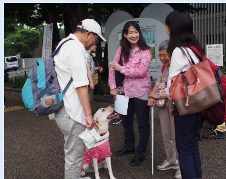
近畿日本ツーリスト社員による バリアフリー旅行研修の様子