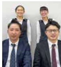
株式会社ジェイ・エス・エス 採用担当

弊社は、海外や国内へ出発されるお客様へ保安検査を実施しております。一見難しい仕事のように聞こえるかもしれませんが、充実した研修で一人前になるまでしっかりサポート検査で使用している機械も、高度化された最先端の検査機器を用いて検査しています。国家資格取得補助もあり入社から1年程度でほとんどの社員が取得しています。この航空保安検査業務はアメリカなどの海外では国家公務員が行っている重要な仕事ではありますが、未経験者でも万全のサポートを受けて活躍できる仕事です。一緒に挑戦してみませんか？