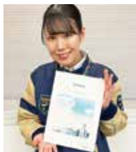
株式会社セノン 成田営業所採用担当