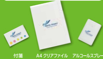
付箋 A4 クリアファイル アルコールスプレー